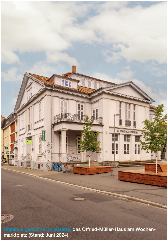
Unsere eigentliche Spielstätte, das Otfried-Müller-Haus am Wochenmarktplatz (Stand: Juni 2024)