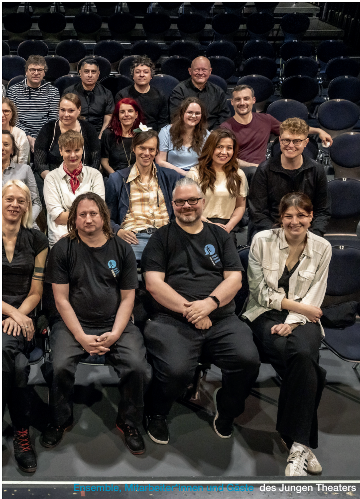
Ensemble, MitarbeiterInnen und Gäste des Jungen Theaters